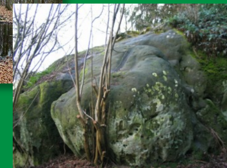
Schleifspurenfelsen Rochers à sillons