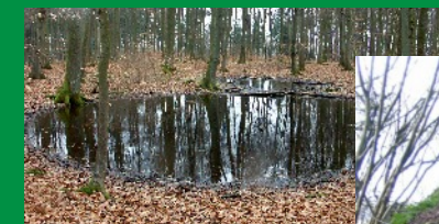
Die Mardellen Les Mardelles

Chapelle d'Altlinster La très ancienne chapelle poétique d'Altlinster est relatée la première fois dans des documents datant de 1570. La construction est typique du moyen-âge. Une des fenêtres représente les armoiries des seigneurs de Linster, dont certains reposent en cette chapelle.