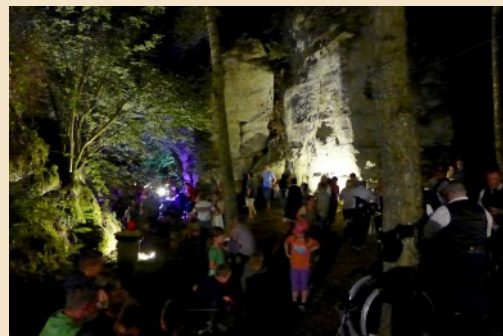
Freylay: „ „Keltisch Nuecht“ - Fête celtique

Le petit village d'Altlinster est situé dans la vallée de l'Ernz blanche. D'origine celtique, il est le village le plus ancien de notre commune. À voir absolument : le monument gallo-romain de la « Härdgeslay », à côté du lieu de culte préhistorique de la « Freylay ». Au temps des romains, il aurait existé à Altlinster un Lanisterum, un lieu d'entraînement pour gladiateurs. À droite du village, dans un vallon nommé « Brill », se trouvait le château-fort ancien des seigneurs de Linster. Les fondations ne furent détruites qu'au 19 e siècle.